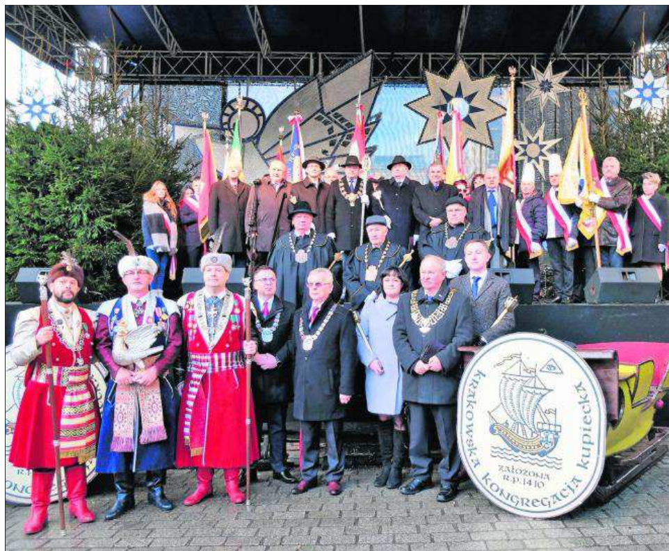
Władze Krakowskiej Kongregacji Kupieckiej oraz goście na estradzie Targów Bożonarodzeniowych w Ryнку Głównym