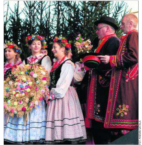
Pięknie zaprezentował się zespół Pszyszowianie z gminy Limanowa