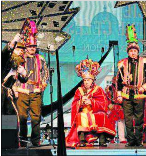
Zespół regionalny reprezentujący gminę Zielonki

Kraków. Do 26 grudnia trwają tegoroczne targi. Oprócz oferty handlowej, aż do drugiego dnia świąt zaplanowano występy