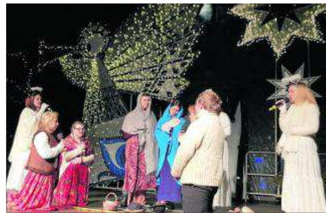
„Betlejem krakowski” w wykonaniu uczniów Zespołu Szkół Rzemiosła

Pani dyrektor z dumą mówi, że obecnie uczy się w szkole 473 dziewczęta i chłopcy, z tego 220 w technikum. Młodzież angażuje się w życie miasta i regionu, uczestniczy w wielu inicjaty-