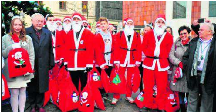
Prezydent Jacek Majchrowski wśród Mikołajów wiozących prezenty dla dzieci w szpitalu im. Żeromskiego