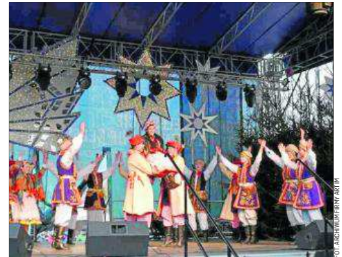
Na estradzie Zespół Pieśni i Tańca „Krakowiacy”