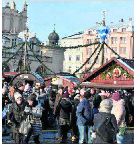
Tłumy krakowian i turystów odwiedzają targi szczególnie w weekendy