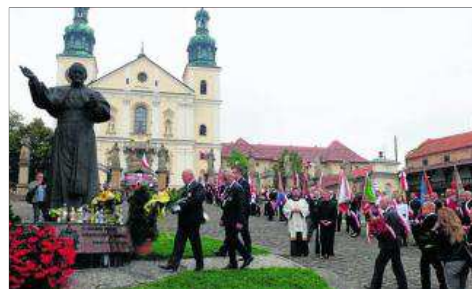
Po raz 13. małopolscy rzemieślnicy 8 września pielgrzymowali do Kalwarii Zebrzydowskiej. Prezesi Izby oraz starsi cechów przed mszą świętą złożyli kwiaty pod pomnikiem świętego Jana Pawła II.